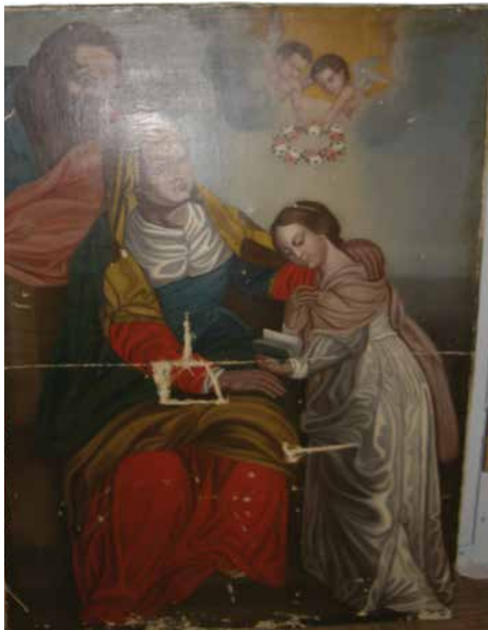
7. Nežinomas autorius. Švč. Mergelės Marijos auklėjimas . XIX a. IV ketv. Drobė, alicjus. Niurkonių Šv. Aloyzo koplyčia (Pasvalio r.). Lijanos Birškytės-Klimienės nuotrauka, 2014. Lietuvos nacionalinis muziejus

Nuotakos-Dangaus karalienės įvaizdis, jos vainikavimas rožių vainiku atitiko to meto Marijos išaukštinimo dvasią. Pats rožių vainiko atributas buvo mėgstamas ir kitokios ikonografijos XIX a. II p. „Švč. Mergelės Marijos auklėjimo“ kartotėse, sukurtose dažniausiai pagal importuotus devocinių paveikslėlių grafikos pirmavaizdžius.