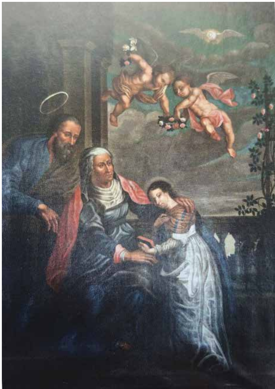
2. Nežinomas autorius. Švč. Mergelės Marijos auklėjimas. XVIII a. II p. Drobė, aliejus. Pinsko Švč. Mergelės Marijos Ėmimo į Dangų bazilika. Iš: Materiály do dziejów sztuki sakralnej na ziemiach wschodnich dawnej rzczyzpospolitej, część 5: Kościoły i klasztory rzymskokatolickie dawnego województwa brzeskolitewskiego , t. 4: Kościół katedralny w Pinsku , ed. Anna Oleńska, Dorota Piramidowicz, Kraków, 2019, il. 183