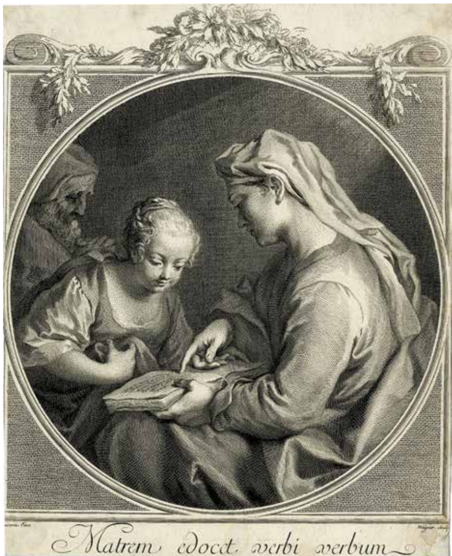
9. Josepho Wagnerio raizinyš pagal Jacopo Amigoni piešinį. Švč. Mergelės Marijos auklėjimas . Venecija. 1725–1766 arba 1730–1760.