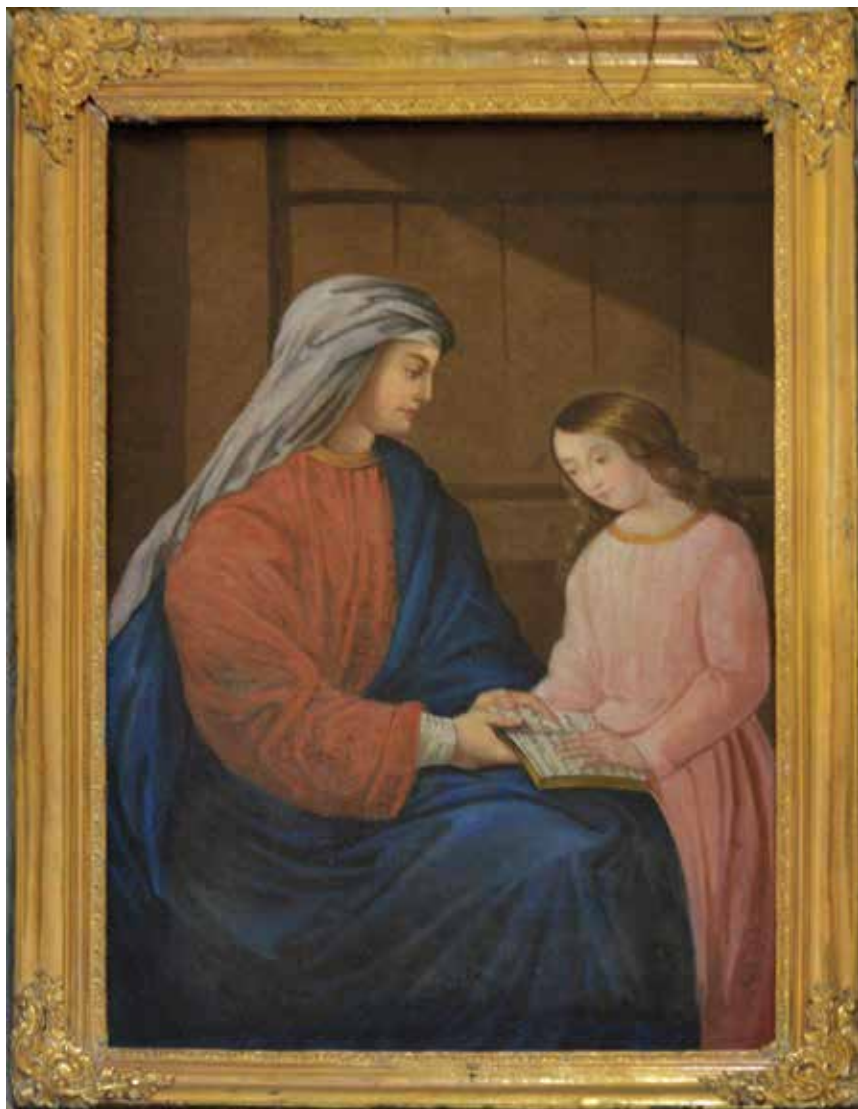
18. Nežinomas autorius. Švč. Mergelės Marijos auklėjimas . XIX a. pab.–XX a. I ketv. Nedzingės Švč. Trejybės bažnyčia. Drobė, alicjus.