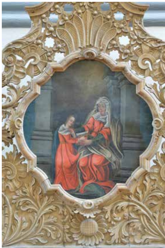
3. Nežinomas autorius. Šv. Mergelės Marijos auklėjimas. XVIII a. III ketv. Drobė, aliejus. Dotnuvos Viešpaties Apreiškimo Šv. Mergelei Marijai bažnyčia.

mo Švč. Mergelei Marijai bažnyčios nešiojamo altorėlio paveikslas 24 (3 pav.). Jo fone matyti naujas motyvas – didingos architektūros fragmentas, mėgstamas vaizduoti XVIII a. II p. sakralinėje dailėje. Iš P. P. Rubenso graviūros pirmavaizdžio (1 pav.) atpažįstami šventųjų drabužiai, Marijos, pasitaisančios skraistę ir laikiančios knygą, motyvai, bet trūksta motinos ir dukters artimumą išreiškiančio gesto, dažno to meto kitokios ikonografijos