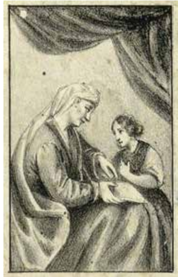
15. Juozapas Ozemblovskis. Švč. Mergelės Marijos auklėjimas . XIX a. 4–8 deš. Litografija. Lietuvos mokslų akademijos Vrublevskių bibliotekos Retų spaudinių skyrius

Šv. arkangelo Rapolo bažnyčios (10 pav.) tapo pirmavaizdžiu vietiniams devociniams paveikslėliams. Pavyzdžiui, Juozapo Jurgio Ozemblovskio Vilniuje atspausta litografija (XIX a. 4–8 deš.) 35 (15 pav.) ir Paryžiuje François Adolphe Bruneau Audibrano (1845–1875) plieno raižinys pagal Hippolyte'o Louis Emile'io Pauquet piešinį 36 (16 pav.), kurio lenkiškame įraše paminėta, kad tai „šv. Ona / pagal