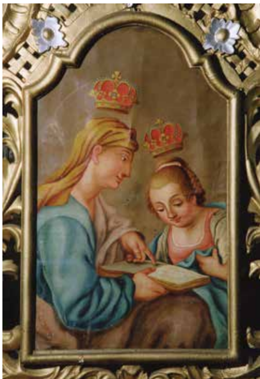
11. Nežinomas autorius. Švč. Mergelės Marijos auklėjimas . XVIII a. III ketv. Drobė, aliejus.

Kiauklių Švč. Mergelės Marijos Apsilankymo bažnyčia. Aloyzo Petrašiūno nuotrauka, 2006. Kultūros paveldo departamento Kilnojamųjų objektų skyriaus archyvas