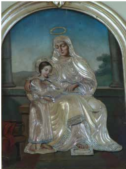
4. Nežinomas autorius. Švč. Mergelės Marijos auklėjimas . XIX a. Drobė, aliejus. Gelvonų Švč. Mergelės Marijos Apsilankymo bažnyčia. Aloyzo Petrašiūno nuotrauka, 2011. Kultūros paveldo departamento Kilnojamųjų objektų skyriaus archyvas

„Švč. Mergelės Marijos auklėjimo“ paveiksluose 25 – Ona nevaizduojama dešine ranka apkabinusi Mariją.