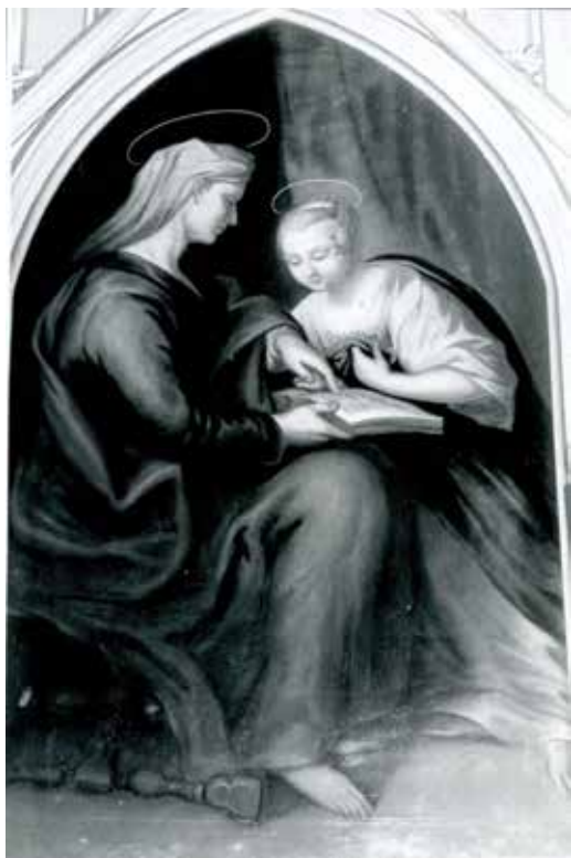
12. Nežinomas autorius. Šv. Mergelės Marijos auklėjimas (neišliko). XIX a. Drobė, aliejus. Pakalnių Šv. Trejybės bažnyčia. Aido Patalausko nuotrauka, 1993. Kultūros paveldo departamento Kilnojamųjų objektų skyriaus archyvas

susitapatinti su atvaizde diegiamu edukacijos pavyzdžiu. Deja, parinktos spalvinės gamos negalime aptarti, nes šis paveikslas sudegė per bažnyčios gaisrą 2000 m. ir liko užfiksuotas tik nespalvotoje nuotraukoje (12 pav.).