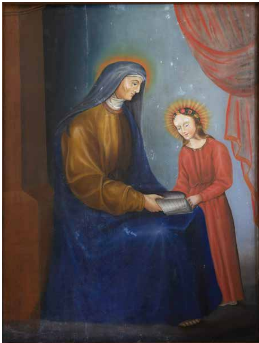
19. Nežinomas autorius. Švč. Mergelės Marijos auklėjimas . XIX a. pab.–XX a. I ketv. Drobė, aliejus. Raudėnų Šv. apaštalo Baltramiejaus bažnyčia.