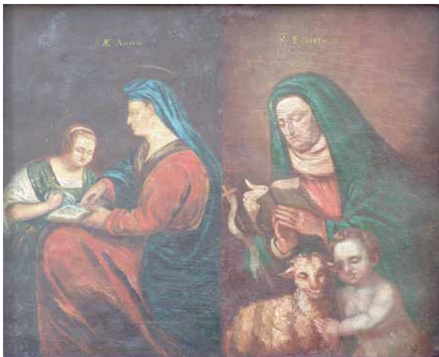
13. Nežinomas autorius. Švč. Mergelės Marijos auklėjimas. Šv. Elžbieta ir šv. Jonas Krikštytojas . XIX a. I p. Metalo skarda, aliejus. Tytuvėnų Švč. Mergelės Marijos bažnyčia.