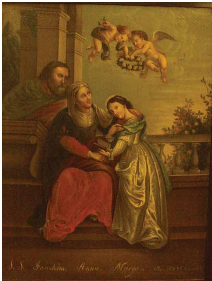
8. Nežinomas autorius. Švč. Mergelės Marijos auklėjimas. 1847. Drobė, aliejus. Nežinoma Žemaitijos bažnyčia. Žemaičių muziejus „Alka“