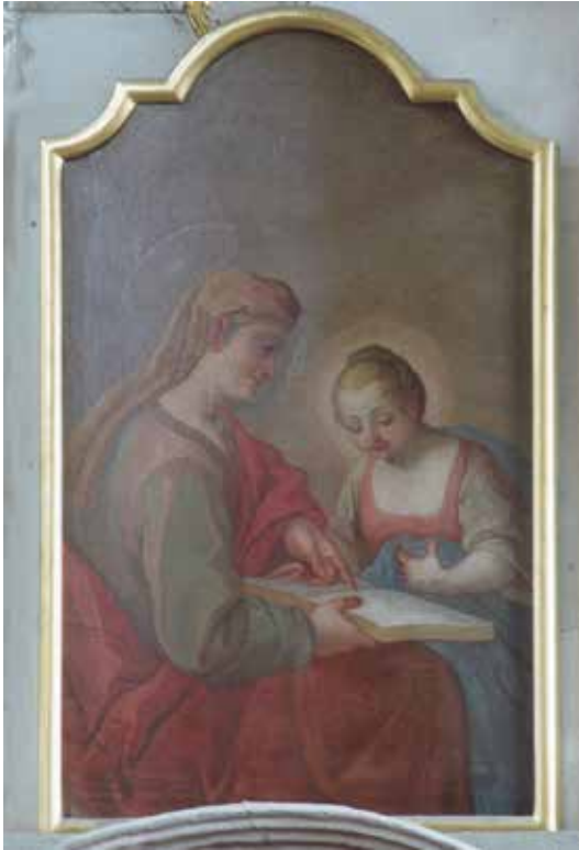
10. Nežinomas autorius. Švč. Mergelės Marijos auklėjimas. XVIII a. III ketv. (iki 1773 m.). Drobė, aliejus. Vilniaus Šv. arkangelo Rapolo bažnyčia.

iki 1773 m. Skirtingai nuo P. P. Rubenso paveikslo kartočių, šis kūrinys yra beveik vienalaikis su pirmavaizdžiu. Palyginus J. Wagnerio graviūrą (9 pav.) su Vilniaus Šv. arkangelo Rapolo bažnyčios paveikslu (10 pav.), akivaizdu, kad jo kompozicija „apversta“ veidrodiniu principu, trūksta šv. Joakimo profilio, virš šventųjų galvų pridėti nimbai 32 . Bažnyčioje, altoriuje prie pilioriaus, buvo atskiras šv. Onos sutuoktinio šv. Joakimo atvaizdas 33 , tad galbūt dėl šios priežasties jis nebuvo nutapytas „Švč. Mergelės Marijos auklėjimo“ paveiksle-kartotėje.