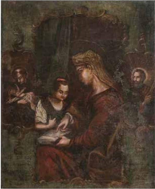
14. Nežinomas autorius. Švč. Mergelės Marijos auklėjimas su šv. Antanu Paduviečiu ir šv. Andriejumi . 1846. Drobė, aliejus. Bockų Šv. Antano Paduviečio bažnyčia. Iš: Katalog Zabytków Sztuki w Polsce , red. nac. M. Zgliński, seria nowa, vol. 12, zes. 4: Katalog Zabytków Sztuki. Województwo Podlaskie (Białostockie). Powiat Bielski , red. Z. Michalczyk, D. Piramidowicz, K. Uchowicz, M. Zgliński, Warszawa, 2019, fig. 518