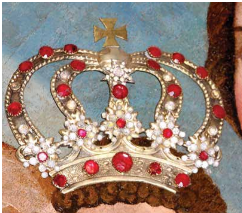
3. Josvainių Dievo Motinos paveikslas. Vaikelio Jėzaus karūna.

Vilnius (?), XVIII a. pab.