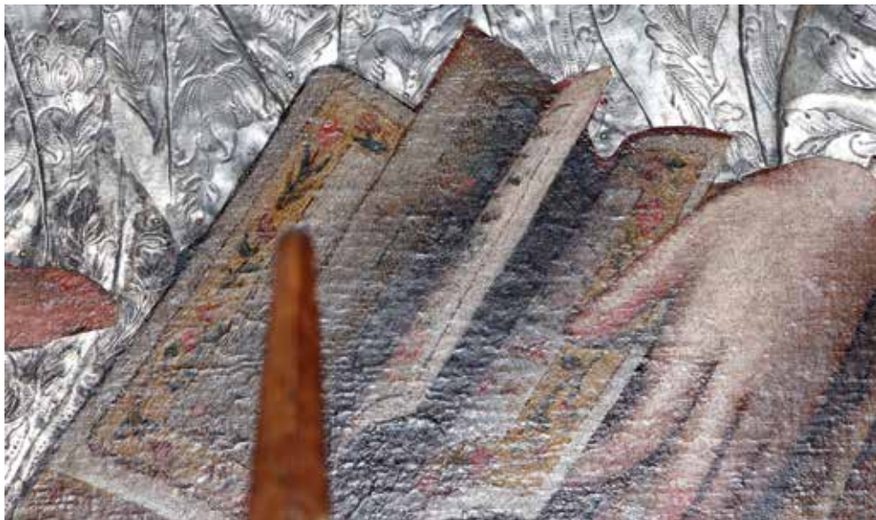
12. Josvainių Dievo Motinos paveikslas. Knygos fragmentas. Renatos Kalvaitės nuotrauka, 2025

bet ir galbūt itališką Josvainių paveikslo originalo kilmę, nes vargu ar artimas kilmingo aristokrato ir dailininko santykis galėjo egzistuoti XVI ar XVII a. Lietuvoje.