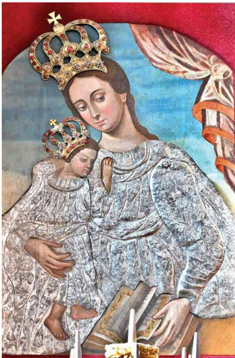
1. Jovainių Dievo Motinos paveikslas. Dabartinis vaizdas. Renatos Kalvaitės nuotrauka, 2025