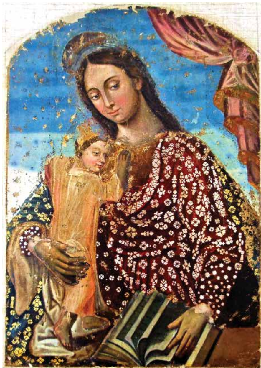
10. Josvainių Dievo Motinos paveikslas restauravimo metu be metalinio aptaiso. Manto Matuizos nuotrauka, 2004