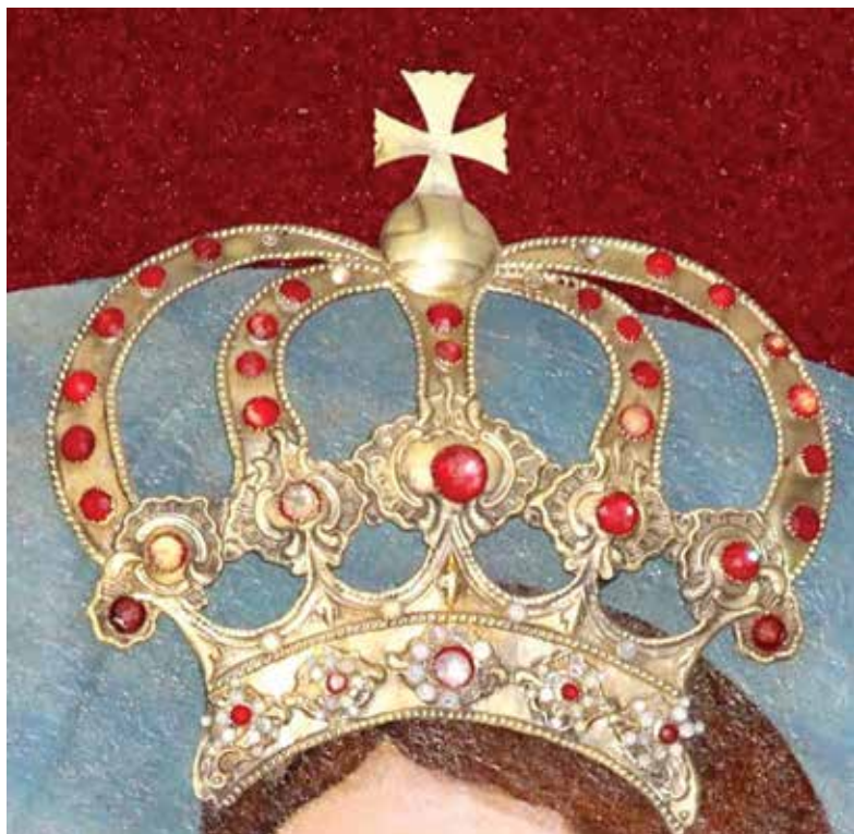
2. Josvainių Dievo Motinos paveikslas. Švč. Mergelės Marijos karūna. Vilnius (?), XVIII a. pab. Renatos Kalvaitės nuotrauka, 2025

raudonos ir geltonos, stambesnės išdėstytos pavieniui, smulkesnės sudaro puošnias rozetes, sukomponuotas iš 10, 15 ar 17 akučių. Vis dėlto svarbu pabrėžti, kad karūnų puošybai buvo naudotas net ne spalvotas stiklas, o jo imitacijos, gaunamos nudažant briaunotų stikliukų plokščius dugnus reikiama spalva. Raudona spalva iki šiol išliko dar gana intensyvi, o geltona spalva jau beveik visiškai išblukusi. Sprendžiant iš kai kurių stikliukų spalvos intensyvumo, galima spėti, kad kartu su stikliukais karūnomis papuošti naudoti ir keli šlifuoti akmenukai.