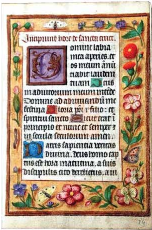
13. Officium Paruum Beatae Mariae Virginis . Apie 1500 m. Biblioteca de la Fundación Lázaro Galdiano, Madridas, Spanija. IS: https://www.bibliotecaazarogaldiano.es/mss/i15516.html

žinių nedaug. XVII a. datuojamame Josvainių paveiksle tokio suolo vaizdavimas yra aiškus anachronizmas, tačiau jis aiškiai parodo, kad Josvainių Dievo Motinos paveikslo prototipas egzistavo ir buvo sukurtas greičiausiai Italijoje galbūt XVI a. I p., kai tapyboje jau reiškėsi manieristinės tendencijos.