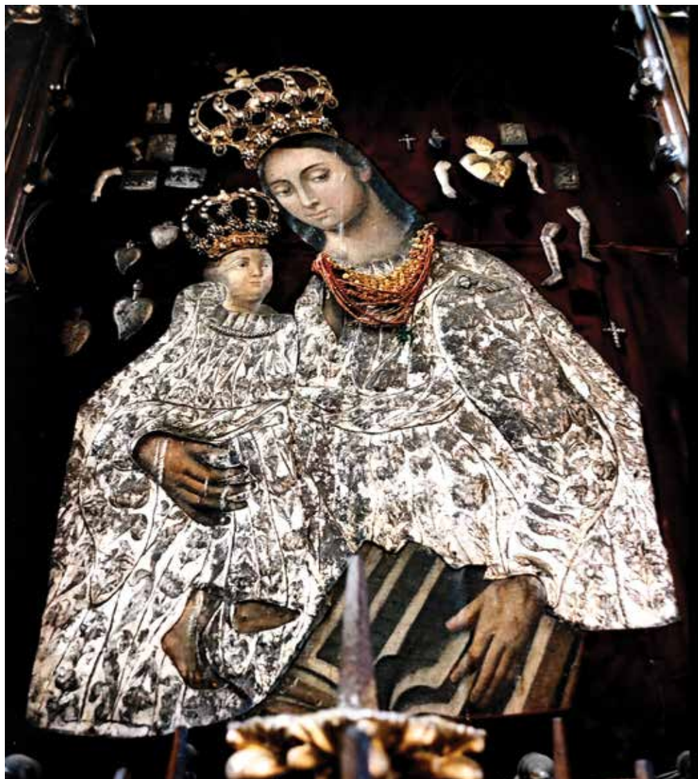
6. Josvainių Dievo Motinos paveikslas prieš 2004–2005 m. restauravimą. Manto Matuizos nuotrauka, 2003