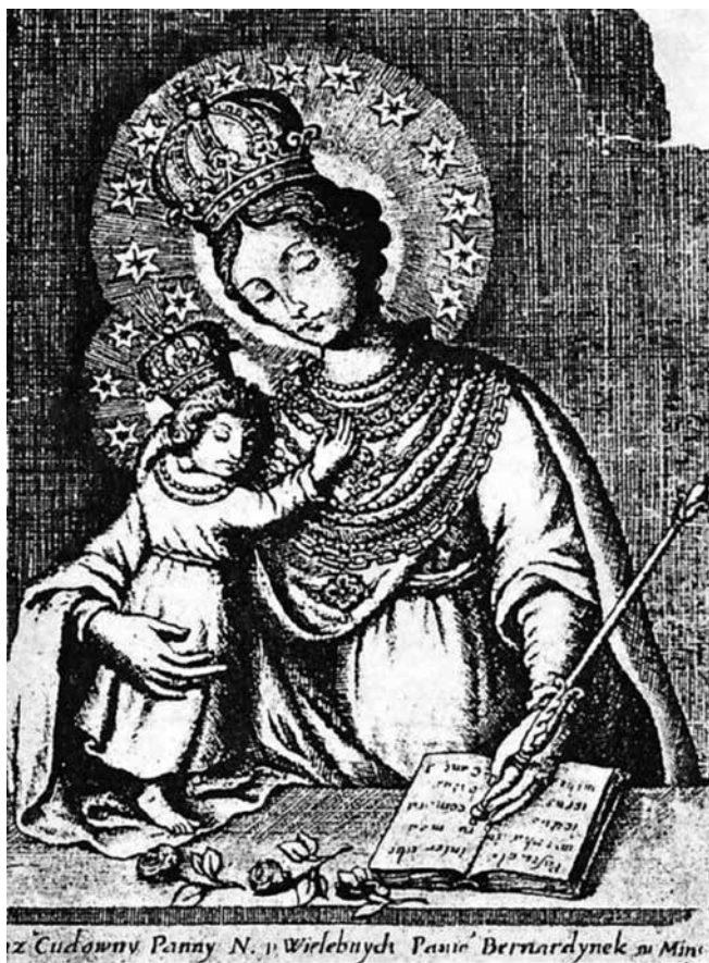
14. Tarasevičius (Aleksandras ar Leonas?). Minsko bernardinių Dievo Motinos paveikslas . Apie 1672 m. Varšuvos nacionalinė biblioteka

žytas kažkurio iš brolių Tarasevičių, vienu iš geriausių to meto Lietuvos gra-verių – vienose publikacijose autoriumi laikomas Aleksandras 52 , kitose – Leonas 53 . Piešinys graviūrai buvo daromas iš natūros, todėl perduoda mums realų vaizdą, kaip Dievo Motinos atvaizdas tuo metu atrodė – detalai per-teikiant ne tik patį paveikslą, bet ir ant jo buvusias uždėtines puošmenas. Atidžiau išsižiūrėjus, galima teigti, kad raižinyje pavaizduotas paveikslas