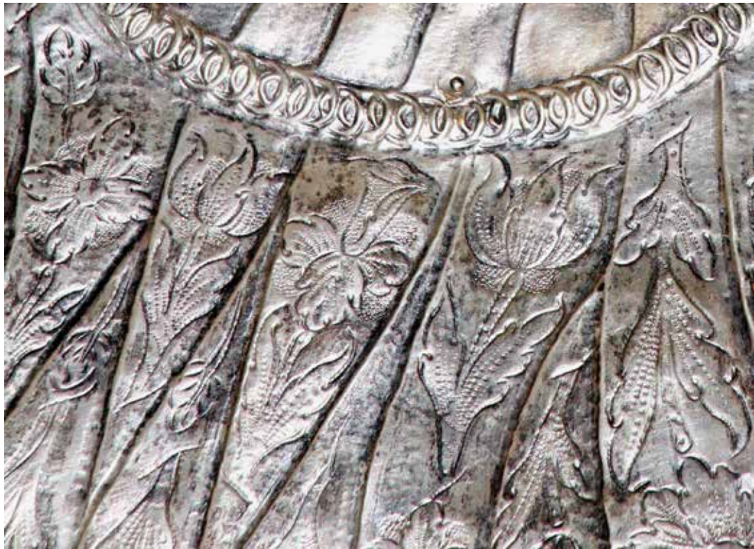
4–5. Josvainių Dievo Motinos paveikslu aptaiso fragmentai. Lietuva, apie 1684–1690 m. (?). Renatos Kalvaitės nuotrauka, 2025

perteiktos vertikaliomis grafiškomis linijomis, daugeliu atvejų lygiagrečiomis, sudarančiomis panašaus dydžio netaisyklingas juostas. Jų vidų užpildo žydinčios gėlės ir lapai, šie motyvai, skirtingai nuo tuo metu dominavusios tendencijos, yra ne kalstyti, o graviruoti ir puncuoti, gėlių koteliai trumpi ir be atšakų, dominuoja tulpių žiedai, nors yra narcizų, vilkdagių ir kitokių rūšių žiedų, lapai pailgi, lengvai karpyti. Specifine, kitur Lietuvoje nepastebėta fantastinių gėlių atmaina laikytinos „pilnavidurės tulpės“ – žiedai su į tulpę panašiais žiedlapiais, supančiais redukuotą saulėgražos žiedyną primenančią vidinę žiedo dalį 37 (4, 5 pav.).