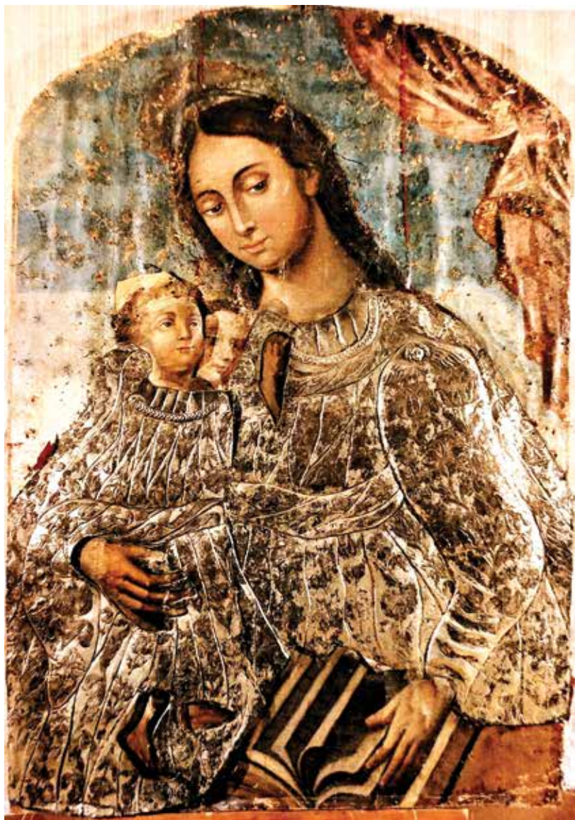
7. Jovainių Dievo Motinos paveikslas restauravimo metu. 2004