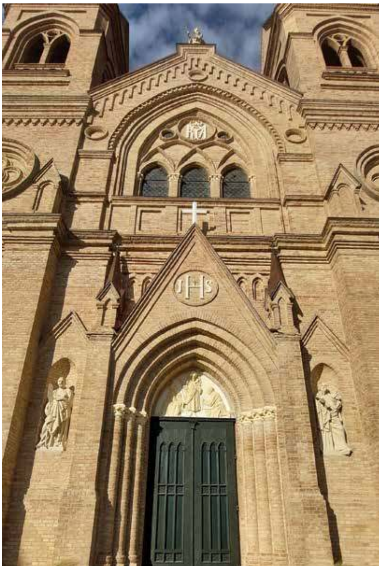
2. Krekenavos Švč. Mergelės Marijos Ėmimo į dangų bazilikos fasado fragmentas. Rimvydo Derkinčio nuotr., 2021