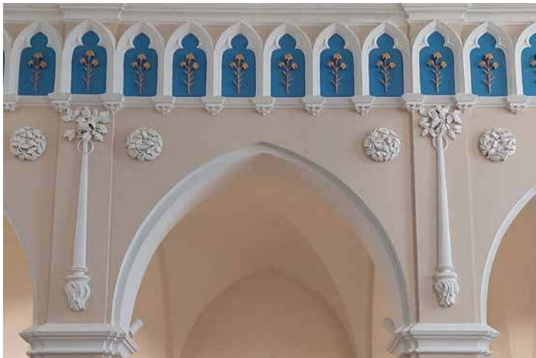
13. Krekenavos bazilikos vargonų choro fragmentas su skulptūriniu dekoru. Rimvydo Derkinčio nuotr., 2021