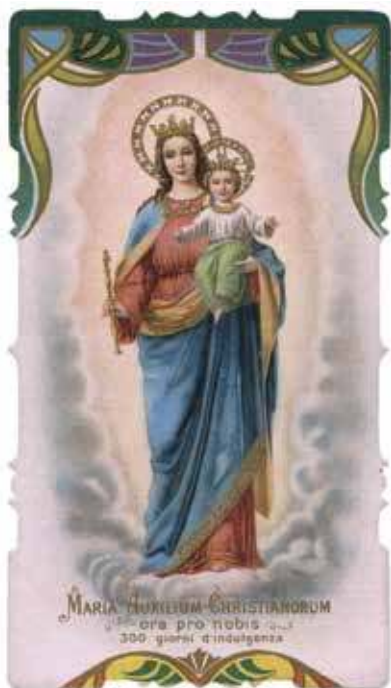
4. Marijos Krikščionių Pagalbos paveikslėlis. Italija. XX a. pr.