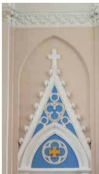
14. Krekenavos bazilikos portalo šiaurinėje navoje viršus. Regimantos Stankevičienės nuotr., 2021

jos padalų paskliautes (11 pav.). Kitos gipso puošmenos išdėliotos presbiterijos šonuose ir prieangius atidalijančiose sienose, jos matomos žiūrint didžiojo altoriaus link ir išeinant iš šventovės. Durų į zakristijas ir šoninių įėjimų portalai sudaryti vien iš reljefinių neogotikinių archivoltų (12, 14 pav.). Jie sukomponuoti iš dviejų smailiųjų arkų: mažesnės didesnėje. Arkas pagražina kryžiai, trilapiai, keturlapiai ar žuvies pūslės pavidalo masverakai ir šonus