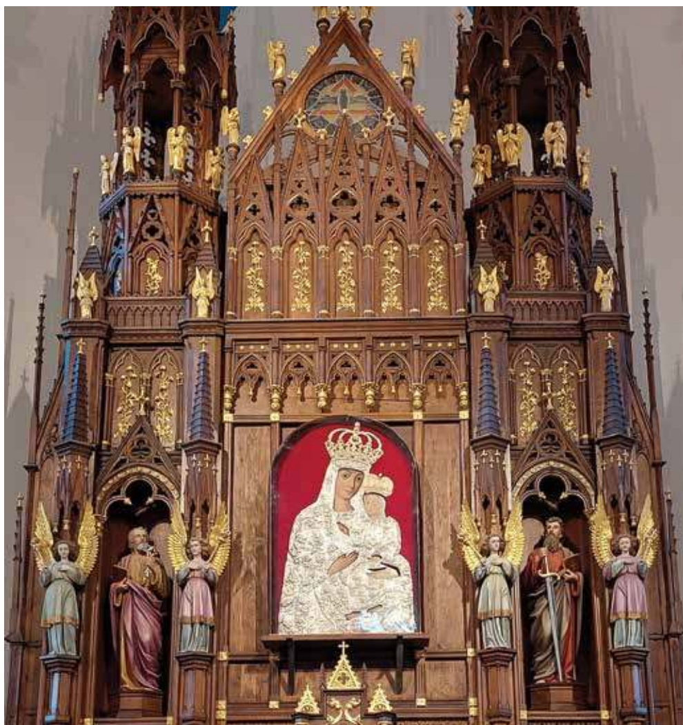
16. Krekenavos bazilikos didžiojo altoriaus centrinė dalis. Rimvydo Derkinčio nuotr., 2021

tik sumažina jos išlakumą, būdingą įrenginiams su išėsta centrine ašimi. Grakštumo altoriui suteikta kitu būdu: panaudojus pasiaurintą, bet aukštą su predelos juosta cokolinę dalį, gausias smailes ir vertikalias linijas bei lengvą, ažūrišką viršų. Altoriaus dvibokštė, trijų vertikalių padalų, o centrine dvitarsnė kompozicija atkartoja bažnyčios fasado struktūrą.