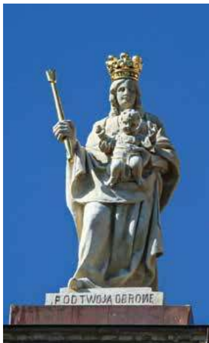
5. Hipolitas Marczewskis. Skulptūra „Švč. Mergelė Marija Krikščionių Pagalba“. 1900. Smiltainis. Krekenavos bazilika.

jo kartotes. Tačiau tikslios kopijos jis nekūrė, tik susiejo Marijos Krikščionių Pagalbos paveikslo pagrindinių figūrų ir stebuklingojo Krekenavos paveikslo ypatybes.