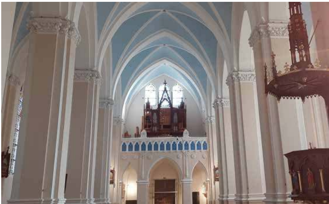
3. Kremenavos bazilikos vidus. Vaizdas į vargonų chorą. Rimvydo Derkinčio nuotr., 2021

čiau, virš skydo, iškelta Švč. Mergelės statula. Pagrindinio fasado dulsvai gelsvo smiltainio statulos ir kitas – gipsinis – dekoras iš plytinių sienų ir jų architektūrinių elementų išskirtas medžiagomis ir jų atspalviais (kurį laiką iki 2021 m. restauravimo spalvų kontrastas buvo ryškesnis, nes visas skulptūrinis dekoras buvo nubaltintas). Dekorą papildo juosvos ąžuolinės durys; jų medžiaga, tamsi spalva ir drožiniai yra tarsi kukli nuoroda į medinės interjero įrangos ansamblio stilių. Šoniniuose fasaduose yra netgi puošnesnės durys, šiauriniame – virš įėjimo, bokšto sienoje, esti apskritimas su statybos pabaigos ir pašventinimo data – „1901“. Vakariniame fasade, ant apsidės galinės sienos, nišoje, kabo medinis kryžius su polichromuota betone Nukryžiuotojo skulptūra.