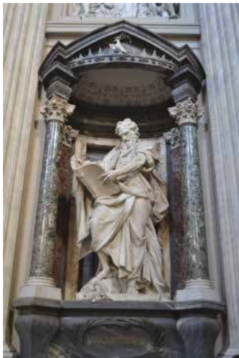
6. Camillo Rusconi. Skulptūra „Šv. apaštalas Matas“. 1708–1718. Marmuras. Laterano Šv. Jono bazilika Romoje.

čios fasadą puošia šių šventųjų, vienu iš parapijos globėjų, atvaizdai. Tačiau statulų ikonografija komplikuoja klausimą.