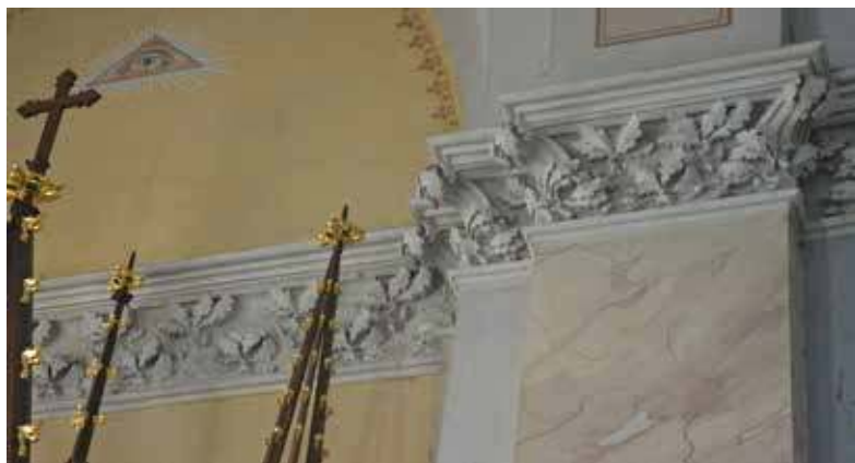
11. Krekenavos bazilikos paskliautės frizo fragmentas.