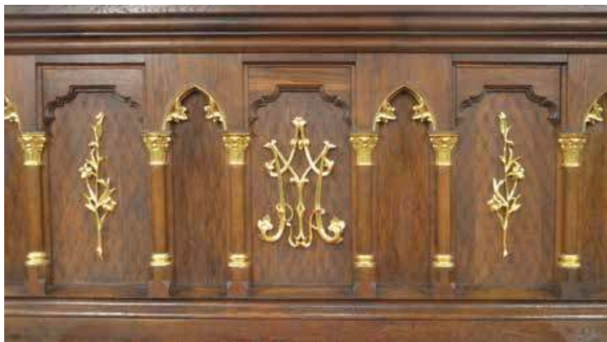
21. Realizuoto altoriaus antepedijaus fragmentas.