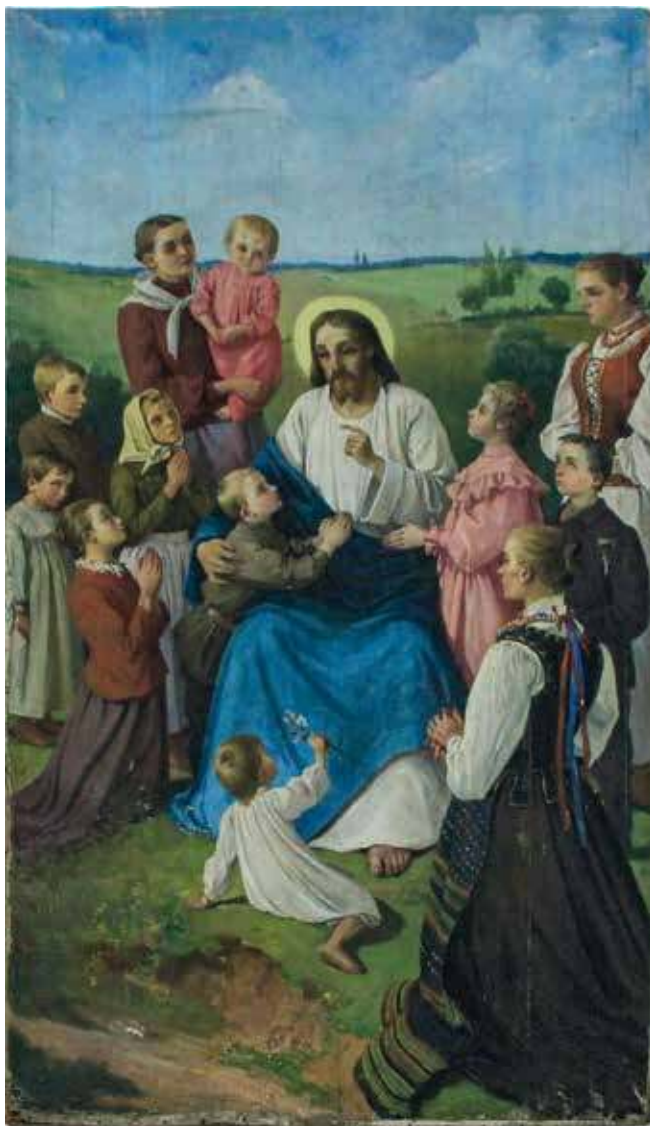
22. Romanas Švoinicis. Paveikslas „Kristus laimina ir moko Lietuvos vaikus (Kristus tarp krekenaviečių)“. 1905. Drobė, aliejus. Krekenavos bazilika. Rugilės Duliūtės nuotr., 2022