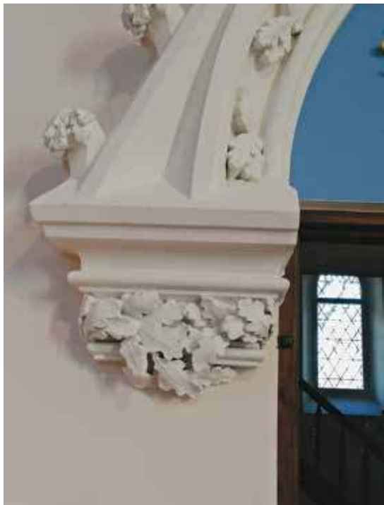
12 a–b. Krekenavos bazilikos presbiterijos siena su lipdiniiais ir lipdinių fragmentas.

Rimvydo Derkinčio ir Regimantos Stankevičienės nuotr., 2021