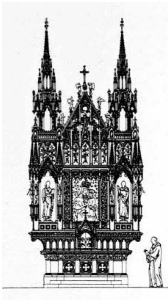
19. Janas Heurichas. Krekenavos bažnyčios didžiojo altoriaus projektas. 1904. Iš: Architektura i Budownictwo (1926), 30