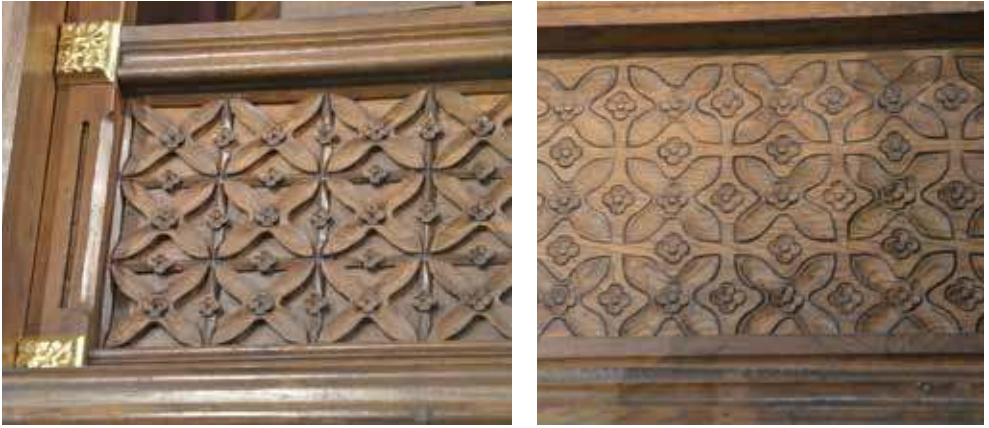
17 a–c. Kremenavos bazilikos didžiojo altoriaus fragmentai. Svetlanos Poligienės nuotr., 2018

kartojimo ir interpretavimo, matoma ir tuomet madinga, tad pageidauta secesinės stilistikos ornamentika. 92