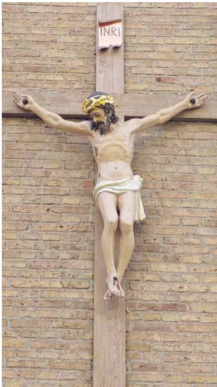
10. Skulptūra „Nukryžiuotasis“. XX a. I ketv. Betonas. Krekenavos bazilika. Rimvydo Derkinčio nuotr., 2021