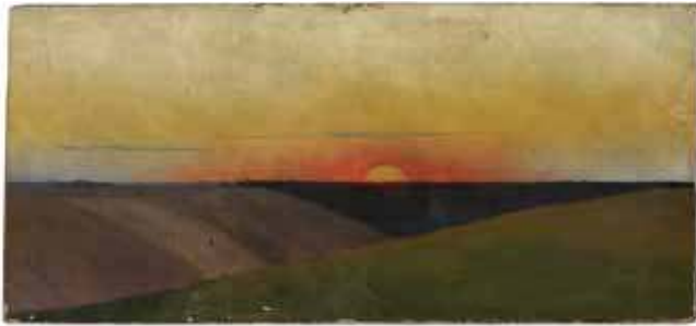
23. Romanas Švoinicis. Peizažas. Saulėlydis. 1903. Drobė, aliejus. Varšuvos nacionalinis muziejus, MP 3711 MNW.

įvairiai: aptinkami „Jėzaus tarp mažų vaikelių“ (vaikų), „Kristaus, mokančio Lietuvos vaikelius“ (vaikus) pavadinimai. 100 Mokymo idėją labiausiai paskleidė XX a. 3 deš. atspausdinti šio paveikslo reprodukcija papuošti krikščioniškojo mokslo brolių Žemaičių vyskupijoje nario bilietai, liudijantys ir apie šio kūrinio vertinimą bei platų žinios apie jį paviešinimą. 101 Bet bene anksčiausiam atvaizdą mininčiame 1907 m. bažnyčios inventoriuje jis įrašytas „Lietuvos vaikus laiminančio Išganytojo paveikslo“ pavadinimu 102 , koreliuojančiu su globos ir ateities vilčių idėjomis, apimančiu ir tautinį akcentą. Pastarasis inventorius surašytas klebonaujant Boleslovui Baronui, laikytinam didžiojo altoriaus (ir vėlesnių naujųjų įrenginių) bei aptariamojo paveikslo užsakovu. Beje, paveiksle matomas Išganytojo gestas panašus į pasitelkiamą pamokant, tad kūriniumi tiktų pavadinimas „Kristus laimina ir moko Lietuvos vaikus“. Prie jo vertėtų pridėti ir antrą, patikslinantį pavadinimą „Kristus tarp krekenaviečių“.