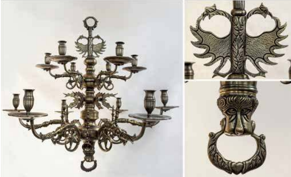
6. Tukumo evangelikų liuteronų bažnyčios sietynas. XVII a. I p. Tukumo muziejus, inv. Nr. TMNM 42613, 2021

kamieno pačiame gale užbaigia nedidelė smailė ar pumpuras, dar kitaip vadinamas finialu 36 .