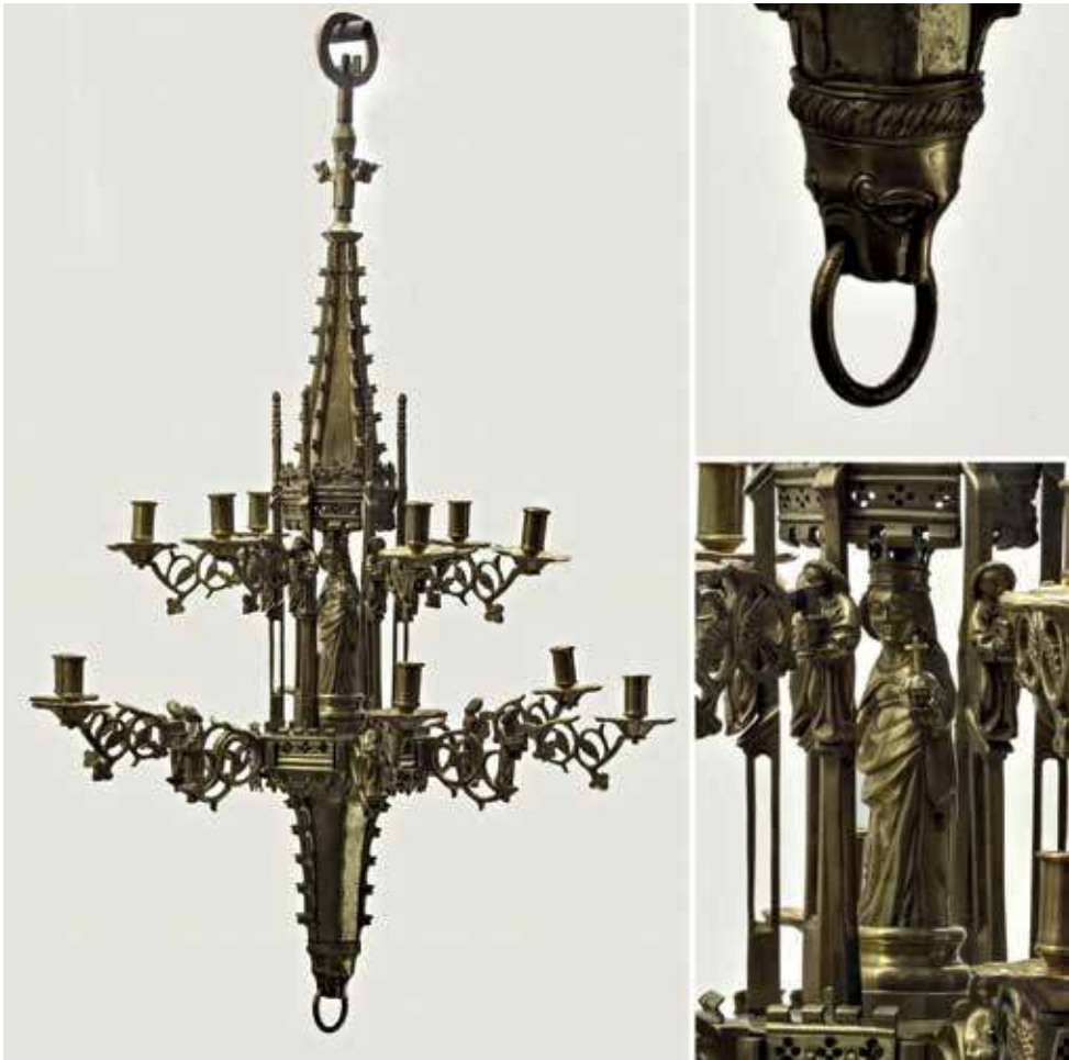
2. XV a. sietynas iš Šv. Kotrynos pranciškonų vienuolyno bažnyčios Rygoje. Rygos istorijos ir laivininkystės muziejus, inv. Nr. VRVM 51887

įkomponuota kopytėlės pavidalo sietyno centre. Šakos išdėstytos dviem aukštais, jas laiko mažesnės, galbūt vienuolius vaizduojančios skulptūrėlės. Taikomosios dailės kūrinyje įamžintas Marijos gerbimas: įžiebus sietyną šviesa apgaubdavo Švč. Mergelės Marijos skulptūrėlę ir keldavo įspūdį, kad šviesa sklinda nuo jos. Lietuvoje privačioje kolekcijoje saugomi, tikėtina, XV a. sietyno su Švč. Mergelės Marijos skulptūrėle fragmentai (3 pav.). Kolekcijos savininko teigimu, fragmentai yra iš Latvijos Krustpilio