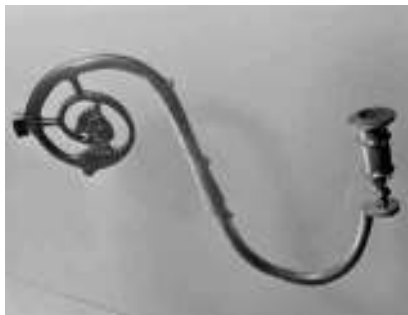
26. Sietyno šaka su vyro veido profiliu ir delfino motyvu. XVII a.–XVIII a. pr. LNM, inv. Nr. IM-4584.