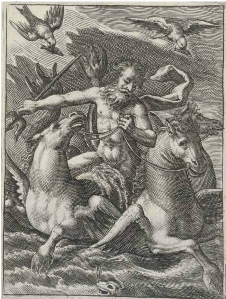
28. Raižinys, vaizduojantis senovės Romos dievą Neptūną. 1635–1660. Valstybinis Amsterdamo muziejus, inv. Nr. RP-P-2004-330-40