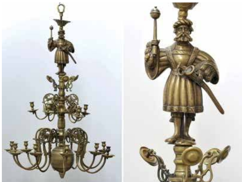
25. Vilniaus arkivyskupijos sietynas (saugomas Valdovų rūmuose). XVI a. pab.–XVII a. Mindaugo Kaminsko nuotr., 2017

pasaulio kraštams. Viktorijos ir Alberto muziejuje saugomi 1530–1550 m. raižiniai, kuriuose personifikuotai atvaizduotos 7 planetos. Jupiteris, didžiausia Saulės sistemos planeta, dažnai vaizduotas ne tik kaip vežimu važiuojantis žaibus laidantis senovės graikų dievas, bet ir kaip senovės Romos karys (24 pav.). Kartais jis raižiniuose jaunas, kartais kaip barzdotas vyresnio amžiaus vyras, dažniausiai dešinėje rankoje laikantis iškeltą kalaviją, kaire prilaikantis skydą. Vokietijos sietynuose Jupiterio skyde dažniausiai iškalamas sietyno fundatorių herbas ar aukojimo įrašas. Vis dėlto norint patvirtinti prielaidą, kad Jupiteris vaizduotas kaip senovės Romos karys, reikėtų išsamesnių XVI–XVIII a. sietynų tyrimų platesniame Europos kraštų kontekste.