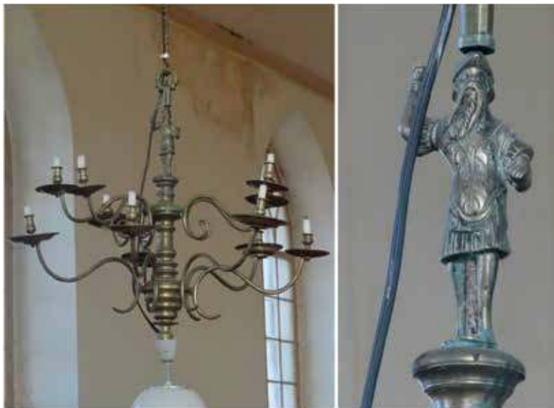
23. Žeimelio evangelikų liuteronų bažnyčios sietynas. XVI a. pab.–XVII a. I p. arba XIX a. I p. Alantės Valtaitės-Gagač nuotr., 2020

XVI–XVIII a. sietynų viršūnės puoštos karių skulptūrėlėmis. Sesavos evangelikų liuteronų bažnyčios Latvijoje (sietynas saugomas Rundalės rūmuose) ir Žeimelio evangelikų liuteronų bažnyčios Lietuvoje sietynų viršuje vaizduojamas karys su šalmu, šarvais ir odiniu diržiniu sijonu (23 pav.). Tokia apranga būdinga senovės Romos kariams. Analogiškos karių skulptūrėlės puošia Vokietijoje išlikusius sietynus 81 , vadinasi, Žeimelio ir Sesavos evangelikų liuteronų bažnyčių sietynai ar bent šio tipo dekoru provaizdis yra atkeliavęs iš germaniškų kraštų. Motyvą padeda paaiškinti XVI a. paplitę ražiniai. Renesanso epocha buvo nevienalytė ir labiau nei bet kuriuo kitu laikotarpiu plito astrologinių simbolių ir alegorinių mitologinių personažų vaizdiniai. 82 Leistos serijos iliustruotų tomų apie planetų įtaką