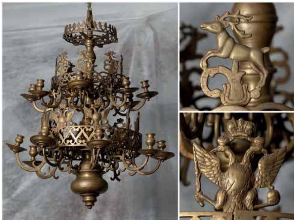
13. Sietynas su elnių ir dvigalvių erelių motyvais. XVIII a.–XIX a. I p. NČDM, inv. Nr. Tt-1707.

Dar viena priešingybė gyvačių įkūnijamam blogiui – erelis. Jis vadinamas paukščių karaliumi ir nuo seniausių laikų dėl savo aukšto skrydžio siejamas su saule, šviesa, dangumi. Ereliai priskiriamos tos pačios savybės kaip feniksui, todėl Viduramžiais jis buvo laikomas atgimimo, krikšto simboliu ir pirmiausia siejamas su Kristumi. 55 Matyt, tokią simboliką erelis įkūnijo ir Lietuvos nacionalinio muziejaus sietyne (9 pav.): išskleistais sparnais virš besirangančių gyvačių vainiko. Kalbant apie paukščius, sietynų viršūnės, kartais ir šakos, dekoruotos stilizuotų paukščių motyvais: tokių išliko ir Latvijoje 56 , ir Lietuvoje 57 (12 pav.), jie paplitę visoje Euro-