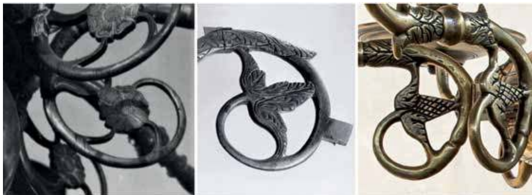
32. Augaliniai motyvai ant Durbės evangelikų liuteronų bažnyčios, Lietuvos nacionalinio muziejaus, Tūkumo evangelikų liuteronų bažnyčios sietynų