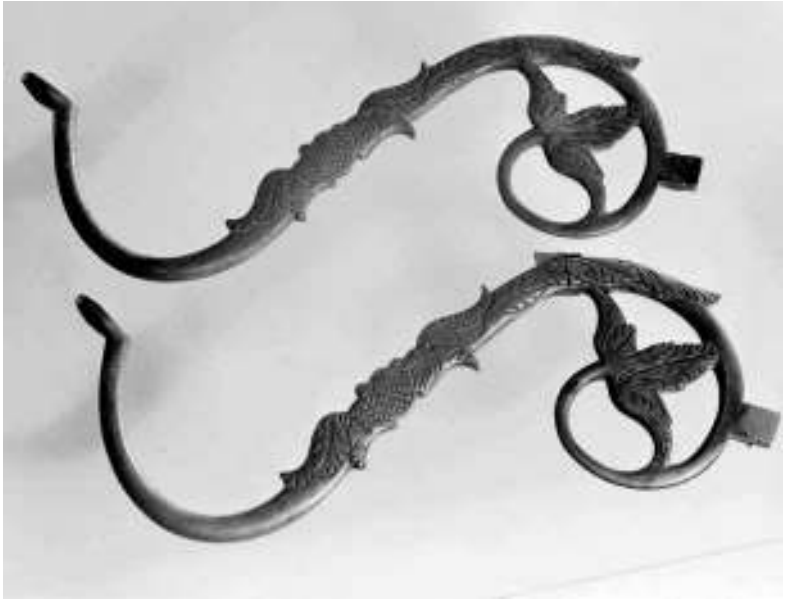
8. Sietyno šakos su delfinų motyvais. LNM, inv. Nr. IM-4583. Vytauto Bartkevičiaus nuotr., 1980

ties sakralinės paskirties objektų puošyboje. Motyvas aptinkamas ant LDK Valdovų rūmuose saugomo sietyno (25, 7 pav.), taip pat delfiniais dekoruotos Lietuvos nacionaliniame muziejuje saugomos pavienės šakos (8 pav.). Latvijoje šviestuvų su šiuo motyvu išliko daug daugiau (žinomi bent 6 vnt.): 1609 m. Durbės evangelikų liuteronų bažnyčios sietynas (5 pav.), XVI a. Tukumo evangelikų liuteronų bažnyčios sietynas (6 pav.), Rygos Šv. Jono evangelikų liuteronų bažnyčios sietynas (7 pav.), Liepojos Švč. Trejybės evangelikų liuteronų katedros sietynas (27 pav.), Umurgos ir Neretų evangelikų liuteronų bažnyčių sietynai. 40