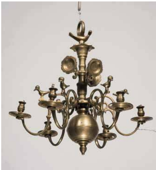
12. Sietynas. XVIII a. LNM, inv. Nr. IM-4621.