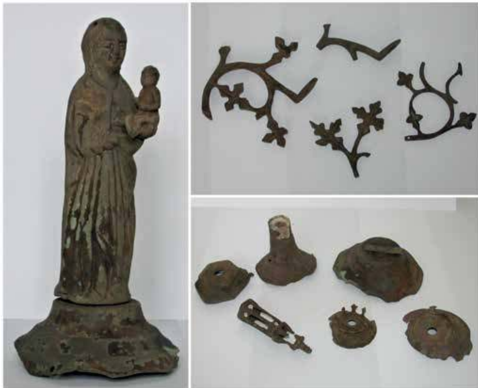
3. XV a. sietyno fragmentai iš Krustpilio (?), Latvijos. Privati kolekcija, Lietuva

teritorijos. Šie sietynai – plačiai Europoje išplitusios viduramžių teocentrinės pasaulėžiūros atspindys: mariologinių motyvų sietynai aptinkami tiek Skandinavijos, tiek Pietų Europos šalyse, pavyzdžiui, Serbijoje. 27 Nors minėti išlikę artefaktai iš Latvijos teritorijų siekia gotikos laikus, svarbu pabrėžti, kad XVI a. ir netgi XVII a. pradžioje Europoje sietynų su Švč. Mergelės Marijos skulptūrėlėmis dar pasitaikydavo. Tai patvirtina Lenkijos katalikų bažnyčiose išlikę dirbiniai: 1609 m. sietynas Varmės Lidzbarko (buv. Rytų Prūsija) Šv. Petro ir Povilo bažnyčioje 28 (4 pav.), XVI a. pr. sietynas Grabuvo (buv. Rytų Prūsija) Švč. Mergelės Marijos