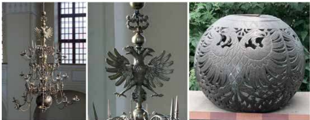
15. Kėdainių evangelikų reformatų bažnyčios sietynas. XVI a. pab.–XVII a. I p.

Dvigalvio erelio herbą pirmiausia naudojo Bizantijos imperija (330–1453), vėliau jį perėmė Habsburgų valdoma Šventosios Romos imperija (962–1806) (16 pav.). Rusijoje dvigalvis erelis buvo žinomas jau XV a. II p. (17 pav.), mat Maskvos didysis kunigaikštis Ivanas III 1472 m. vedė Bizantijos imperatoriaus dukterėčią Sofiją. Skelbdamasis Bizantijos imperatoriaus įpėdiniu jis perėmė ir jos herbą – Dvigalvį erelį. Vis dėlto šis herbas buvo nepopuliarus ir Rusijoje ilgą laiką dominavo senasis simbolis – Maskvos globėjas šv. Jurgis. Dvigalvis erelis Rusijoje įsigalėjo tik XVIII a. pradžioje, o Šv. Romos imperijos erelio išvaizdą rusiškasis perėmė tik XIX a. pabaigoje. 61