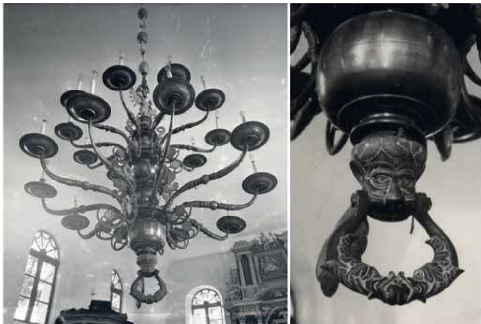
5. Durbės evangelikų liuteronų bažnyčios sietynas. 1609. NKMP Paminklų dokumentacijos centras, bylos Nr. 08-04-III, IV-27-D-1721

jie buvo pagaminti XVI a. II p. arba XVII a. I p. Verta paminėti dydžiu ir dekoru išsiskiriantį 1609 m. Durbės evangelikų liuteronų bažnyčios sietyną, užbaigtą šiuo motyvu (5 pav.), 2017 m. restauruotą Tūkumo evangelikų liuteronų bažnyčios kabantį šviestuvą (6 pav.). Svarbu pridurti, kad barokiniai XVII a. II p.–XVIII a. sietynai šiuo motyvu jau nebepuošiami. To priežastis buvo ne tik besikeičiantis tam tikrų dekoru elementų populiarumas, bet ir sietynų formos / struktūros pasikeitimai: renesansiniai sietynai neturėjo rutulio arba jis buvo gana mažas, dar „neišsivystęs“, todėl liūto galvutė kamieno apačioje funkcionavo kaip dekoratyvus akcentas (1 pav.). Kiek vėliau, XVII a. II p. ir XVIII a., barokinių sietynų akcentas – stambus nublizgintas rutulys / sfera, kurį sietyno