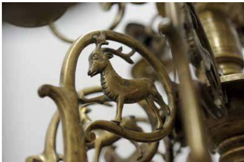
11. Vilniaus arkivyskupijos sietyno šakos dekoru elementas – elnias. XVI a. pab.–XVII a. Mindaugo Kaminsko nuotr., 2017

struktūros XV a. belgiško sietyno kopija saugoma Metropolitano muziejuje Niujorke. 50 Minėtuose gotikiniuose sietynuose ramiai tupintys kilnūs elniai vaizduojami apsupti žemiau besirangančių drakonų, krikščionybės tradicijoje simbolizavusių velnią. Ši sietynuose perteiktą siužetą paaiškina pasakojimas ankstyvosios krikščionybės veikale „Physiologus“, kai elnias prispjauo vandens į kiekvieną žemės plyšį, kuriame tūno pasislėpusios nuodingosios gyvatės, tada jas ištraukia ir sutrypia. Veikale sakoma: „Taip sunaikink, Viešpatie, gyvatę, velnią dangiškuoju vandeniu.“ 51 Elnias ne tik sietas su gyvybės vandeniu, stovintis ant gyvatės, šėtono galvos, jis tapatinamas su Kristumi. 52