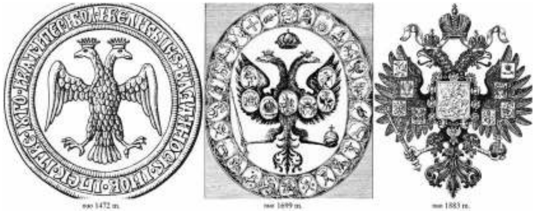
17. Rusijos herbo – Dvivalgio erelio ikonografinė raida 1472, 1699 ir 1883 m.