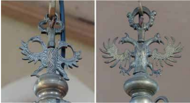
14. Žeimelio evangelikų liuteronų bažnyčios sietynų viršūnės – dvigalviai ereliai. XVIII a. (?), XIX a. I p. Alantės Valtaitės-Gagač nuotr., 2020

poje. Dėl sparnų ir skrydžio paukščiai nuo seno laikyti tarpininkais tarp žemės ir dangaus. 58