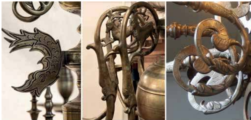
7. Tukumo evangelikų liuteronų bažnyčios, Vilniaus arkivyskupijos ir Rygos Šv. Jono evangelikų liuteronų bažnyčios sietynai su delfinų motyvais

Jėzus prilyginamas liūtui: „Štai nugalėjo liūtas iš Judo giminės, Dovydo atžala.“ 38 Matyt, dar gotikoje imta naudoti liūto – Kristaus ar Prisikėlimo – paralelė buvo tęsiama ir renesansinių sietynų puošyboje.