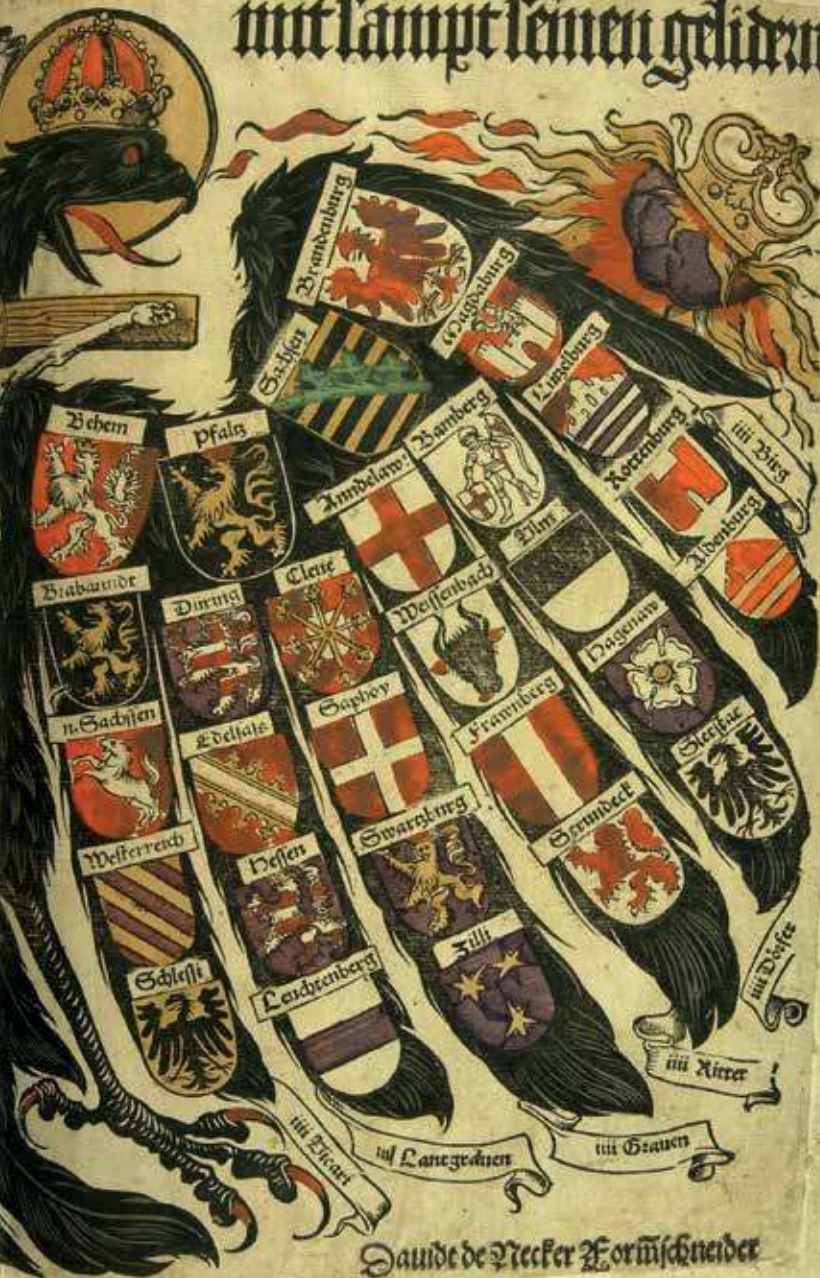
16. David de Necker. Šv. Romos imperijos herbas, 1510.