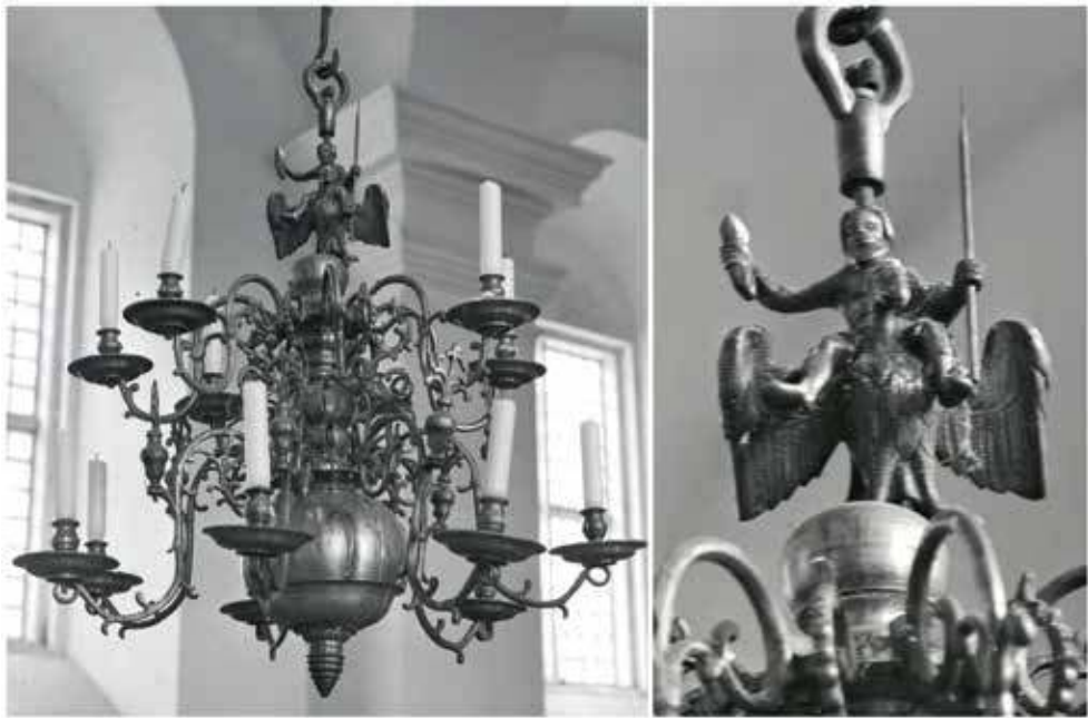
19. Subatės evangelikų liuteronų bažnyčios Latvijoje sietynas. XVII–XVIII a. NKMP Paminklų dokumentacijos centras, neg. Nr. 8054, 1975 m. nuotr.

nei šimtmetį ši skulptūrėlė buvo laikoma vieninteliu populiaraus senovės lietuvių ir baltų mitologijos dievo Perkūno atvaizdu. Anuomet smarkiai romantizuotą visuomenės požiūrį iliustruoja ir tai, kad 1905–1907 m. buvo išleistas atvirukas su skulptūrėlės atvaizdu. 70 Iš tiesų jau XIX a. būta dvejonių dėl šios skulptūrėlės pirminės paskirties, o XX a. 7 deš. Lietuvos istorikai dar rimčiau ėmė svarstyti, kad galbūt tai Žemutinėje Saksonijoje pagamintos žvakidės koja. 71 Daugėjant taikomosios dailės tyrimų Europoje, o muziejams ir bibliotekoms suskaitmeninus ir paskelbus daugelį rinkinių, galima tvirtai teigti, kad ši 12 cm detalė yra sietyno viršuje montuojamas dekoru elementas. Tą patvirtina ir vertikaliai skulptūrėlės einanti ertmė, per kurią ji buvo užmauta ant kamieną formuojančio sietyno strypo. Remiantis išlikusių pavyzdžių ikonografija