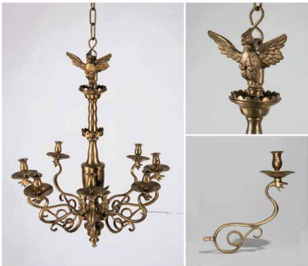
9. Sietynas su gyvatės / žalčio šakomis ir ereliu. XVI a. pab.–XVII a. I p. (?). LNM, inv. Nr. IM-13029.