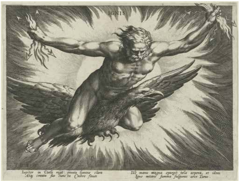
21. Dievas Jupiteris, vaizduojamas kaip ugnis, iš serijos „Keturi elementai kaip mitologinės figūros“. 1587. Valstybinis Amsterdamo muziejus, inv. Nr. RP-P-OB-7472

pateikia įžvalgą, kad nepažabotai skriejantis ant erelio nugaros pažinimo ir atradimų kupiname Renesanso laikotarpyje Jupiteris taip pat galėjo būti siejamas su pasaulio ir visatos begalybe. 79 Kaip tik šią reikšmę gerai atspindi faktas, kad Jupiterio atvaizdu buvo dekoruojami ne tik sietynai, bet ir kiti to meto dirbiniai, pavyzdžiui, laivai ir papuošalai. Jų piešiniai saugomi garsiausiuose Europos muziejuose. 80