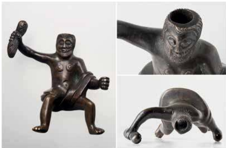
20. Sietyno detalė. XVII–XVIII a. LNM, inv. Nr. AR 690:1. 2021

Latvijoje, Lenkijoje ir Vokietijoje, galima teigti, kad Lietuvos nacionalinia­me muziejuje saugomam „Perkūnui“, tiksliau – Jupiteriui, trūksta erelio, ant kurio jis skrietų, ir jėgos / valdžios simbolio (ieties, buožės ar skeptro).