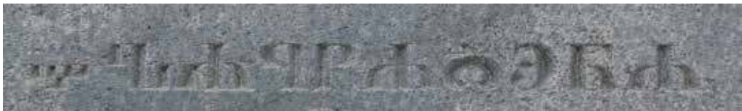
9a. Vasilijaus Kislovo antkapinio paminklo epigrafo fragmentas. Žodis, užrašytas glagolica. Jurgitos Kristinos Pačauskienės nuotr., 2021