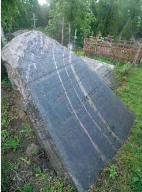
11. Juozapo Horbacevičiaus antkapinis paminklas.

Jurgitos Kristinos Pačkauskienės nuotr., 2020