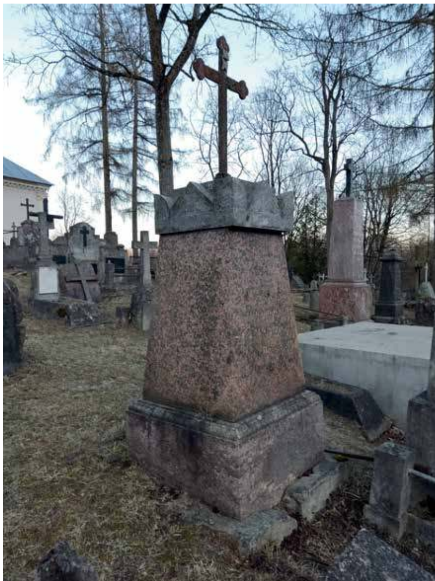
4. Izabelės Rudaminaitės-Šyrynovos paminklas Rasų kapinėse, po 1849 m. 2022