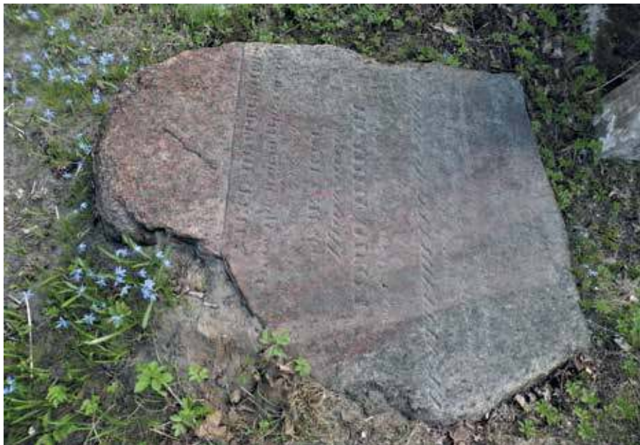
14. Ipolito ir Jekaterinos Gomolickių antkapinis paminklas.

2021