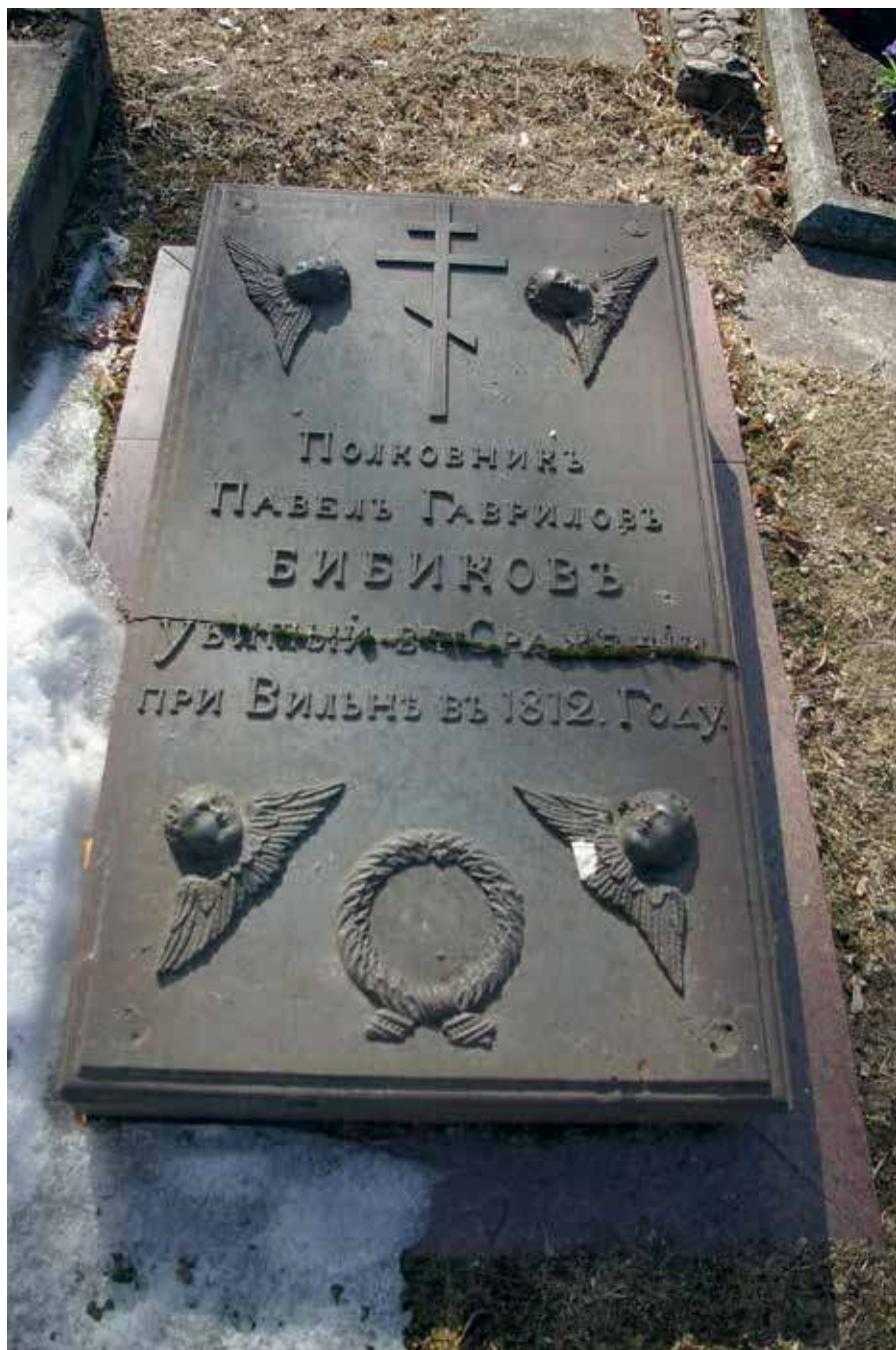
1. Pavelo Bibikovo antkapinė plokštė, 2020