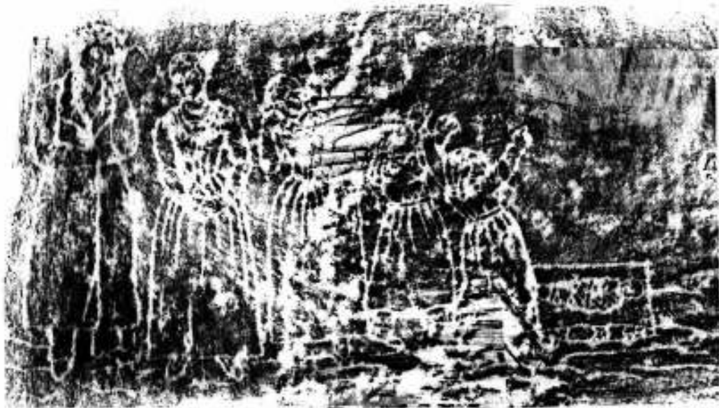
16. Frotažas, nuimtas nuo Gomolickių antkapinio paminklo, 2021

tys ir vienas suvystytas, paguldytas ant (ar į?) sunkiai identifikuojamo daikto (15 pav.).