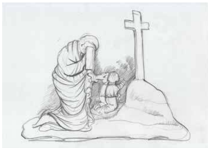
13. Juozapo Horbacevičiaus antkapinio paminklo figūrinio reljefo piešinys. Jurgitos Kristinos Pačkauskienės pieš., 2020