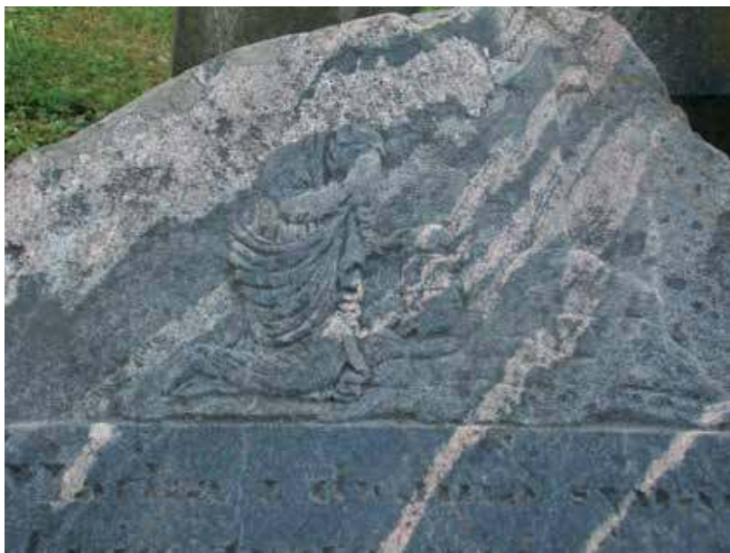
12. Juozapo Horbacevičiaus antkapinio paminklo reljefas. 2020