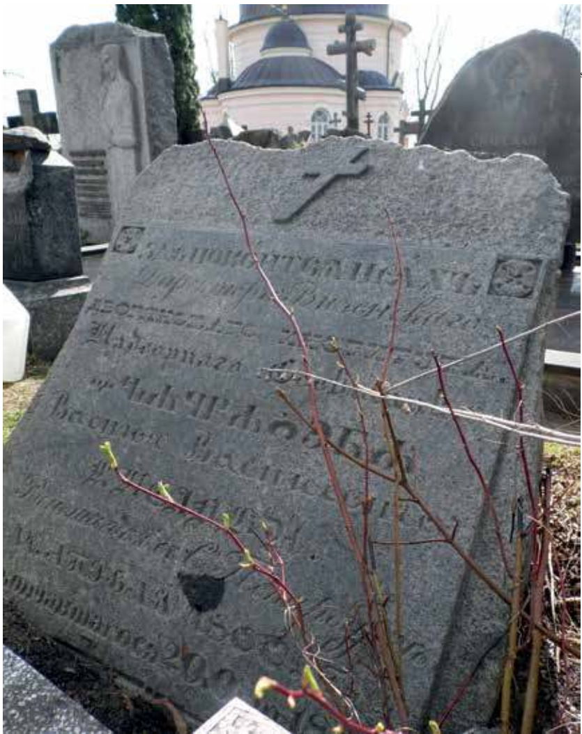
9. Vasilijaus Kislovo antkapinis paminklas. Jurgitos Kristinos Pačauskienės nuotr., 2021