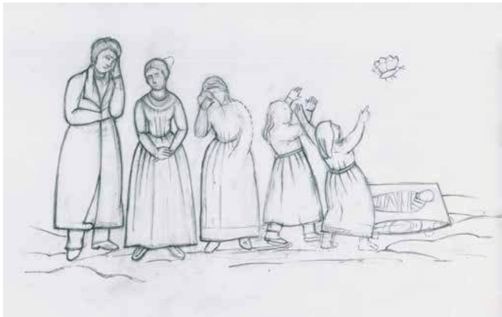
15. Raižinio Gomolickių antkapiniame paminkle rekonstrukcija.

Jurgitos Kristinos Pačkauskienės pieš., 2021