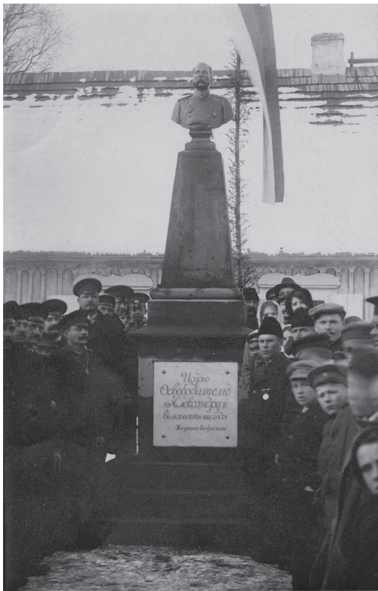
Paminklo Aleksandriui II atidengimas Tauragėje 1911. LNB RS