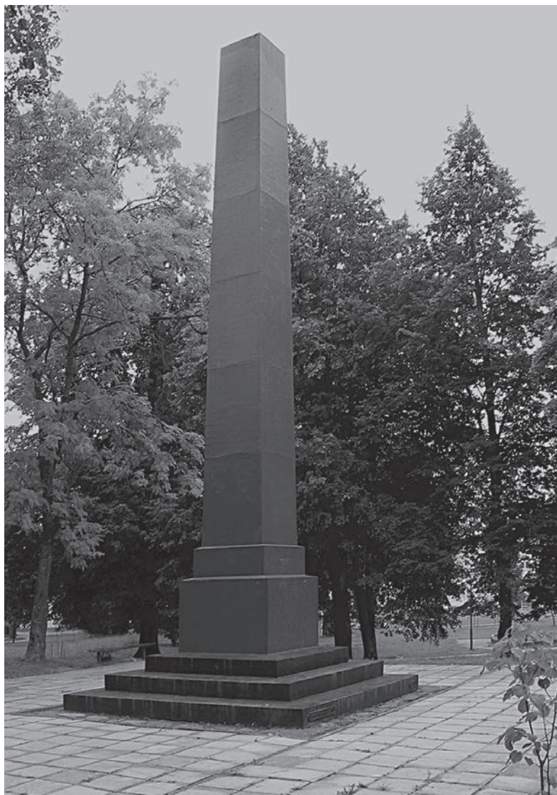
Obeliskas Zarasuose. 2005