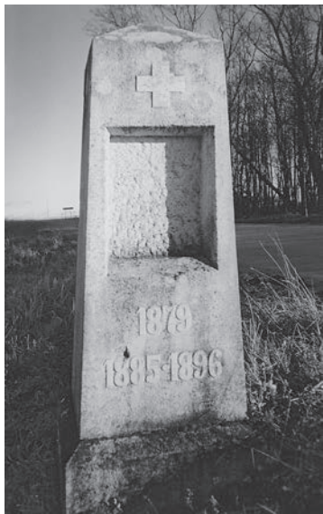
Veriovkinų paminklas Vyžuonėlių dvare prie Utenos–Svėdasų plento

sų link, XIX–XX a. sandūroje pastatė paminklą – kuklų cementinį architektoninį bloką su niša šventam paveikslui, graikišku kryžiumi ir trimis įrašais: „1879, 1885–1896“. Esu nuodugniau susipažinusi su šios giminės istorija, tad galiu teigti, kad pirmasis įrašas reiškia dvaro įsigijimo datą, antrasis ir trečiasis – tėvų, įsigijusių dvarą, mirties datas – motinos Jelizavetos Veriovkinos ir tėvo Vladimiro Veriovkinio. Vyžuonėlių dvaras jų šeimai tapo itin brangia vieta, savotiška tėvonija, tad šios trys datos – dvaro atsiradimo jų šeimoje ir laiko, kurį jame praleido tėvai, tapo pagrindiniais riboženkliais šeimos istorijoje, ku-