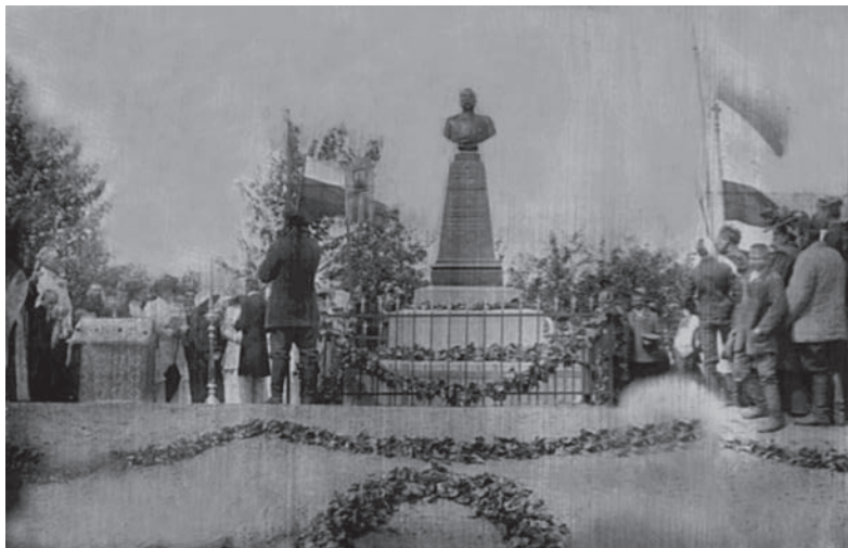
Paminklo Aleksandru II atidengimas Utenoje 1911.