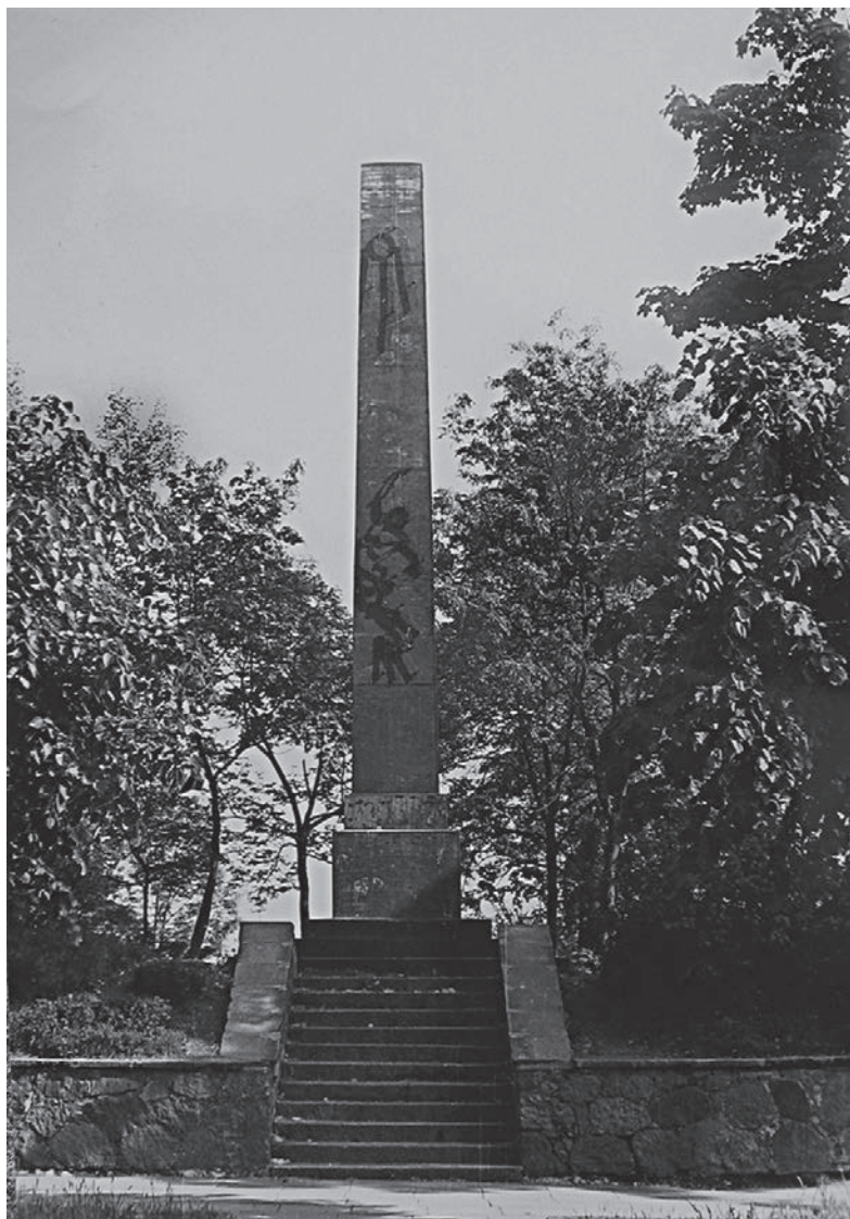
Obeliskas Zarasuose. 1932. ZKM