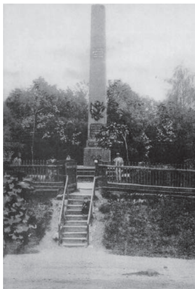
Obeliskas Daugpilio–Kauno kelio statybai. 1907. ZKM