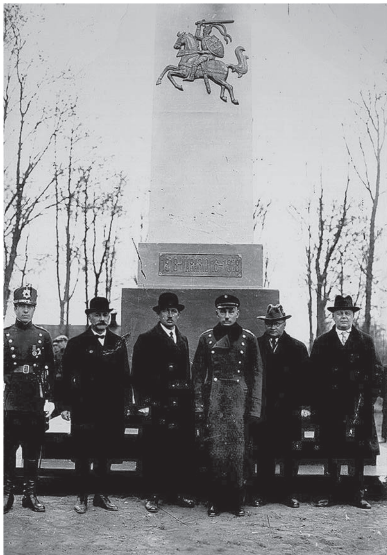
Obeliskas Zarasuose. Apie 1932. ZKM