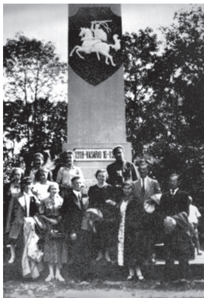
Obeliskas Zarasuose. 1938. ZKM

I dešimtmečio pradžioje. Praktę laisvieji valstiečiai galėjo šviestis, leisti vaikus į mokslus, skaityti nelegalią lietuvišką spaudą. Iš tų valstiečių išėjo lietuviškoji inteligentija, nacionalinio atgimimo iniciatorė ir pagrindinė veikėja. Dailės istorikai yra atkreipę dėmesį, kad būtent pobaudžiaviniame laikotarpyje suklestėjo valstietiškas liaudies menas, pirmiausia kryždirbystė. Tad požiūris į baudžiovos panaikinimą ir jo pasekmes Lietuvos kaime nebuvo tik neigiamas. Valstiečiai jautė skirtumą tarp baudžiovos