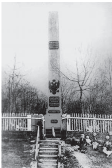
Obeliskas Daugpilio–Kauno kelio statybai. Apie 1914.

naus – Aleksandro vardą 2 , čia turėjo iškilti ir paminklas kelio statybai. Toks vietos pasirinkimas turėjo savo taktiką, šią vietovę nutarta išaukštinti, aplenkiant galutinius naujojo kelio atkarpos punktus – Daugpilį ir Kauną, žymiai svarbesnius, didesnius miestus, turinčius savą istorinį „bagažą“. Naujoji vietovė buvo „tabula rasa“, ji neturėjo Rusijos užimto krašto praeitį menančio paveldo, istorinių praeities žymių, negalėjo kelti nepageidaujamų asociacijų. Tai turėjo būti naujas Lietuvos miestas, skirtas caro garbei, miestas-paminklas. Carų globa bažnytkaimiui atnešė didžiules permainas – jam suteiktas apskrities centro statusas, iš Vidžių (Baltarusija) perkeltos administracinės įstaigos, suteiktas mies-